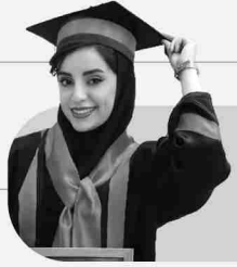
عسل خوش خلق دانش آموز تخته مشاوره دانشگاه فرهنگیان