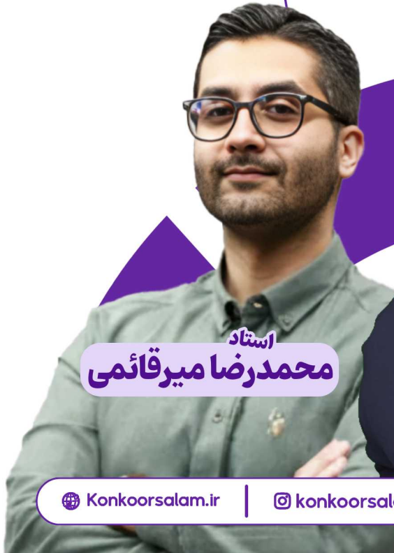
استاد محمد رضا میرقائمی