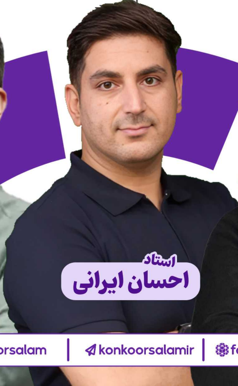
استاد احسان ایرانی