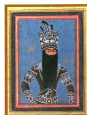
فتحعلی شاه اثر مهر علی نقاش