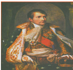
ناپلئون بناپارت امپراتور فرانسه