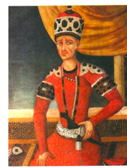
آقا محمد خان قاجار