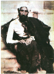
میرزا رضا کرمانی