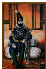
نگاره محمد شاه